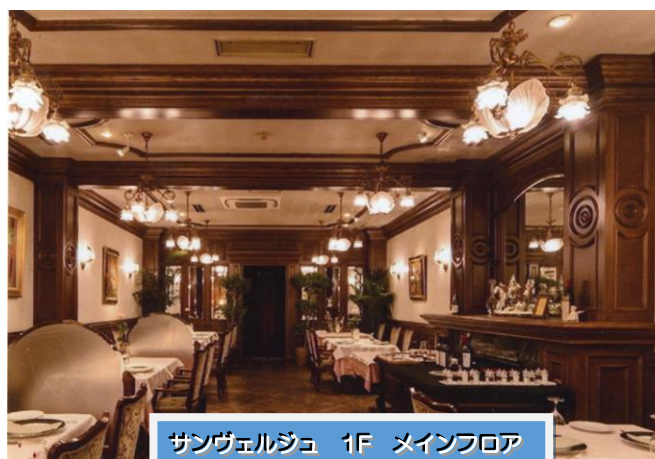
サンヴェルジュ 1F メインフロア