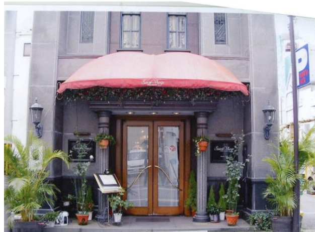
サンヴェルジュ 玄関口

↓ 懇親会 (希望者のみ) 18:00~20:30 入場料 無料 会費 4,000円